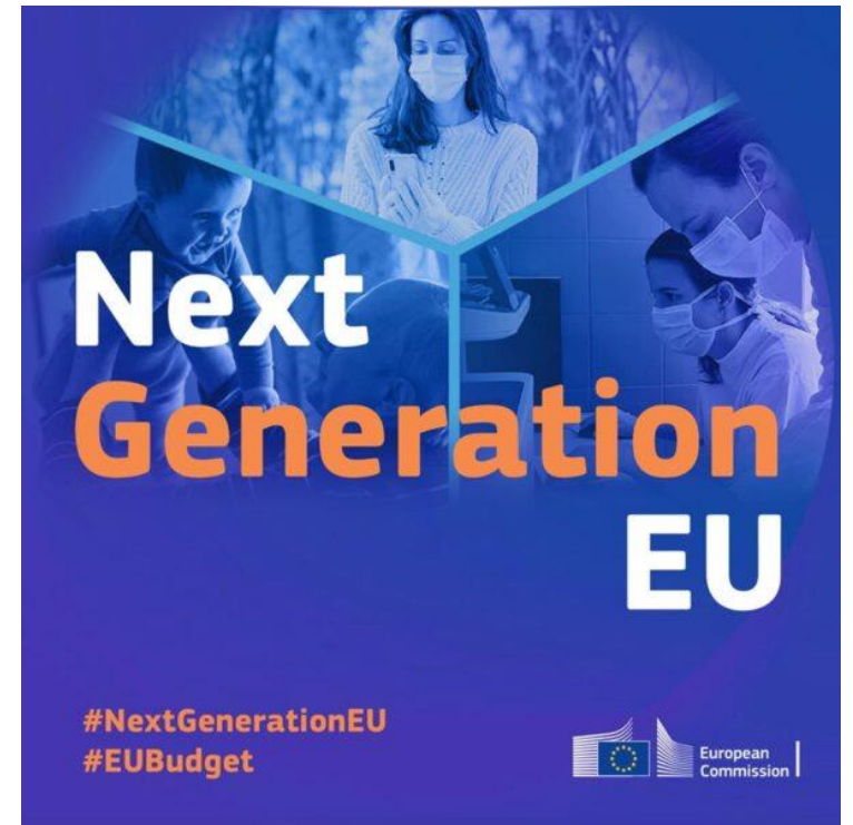
EU expenditure 2021-2027